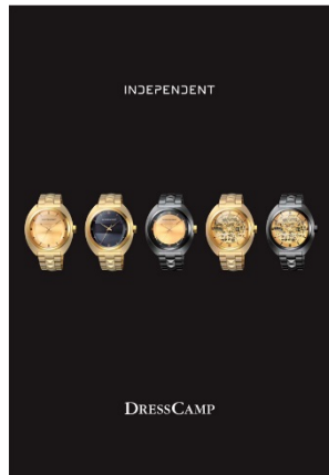
INDEPENDENT DRESSCAMP コラボレーションモデル 各30,000円+税 数量限定各モデル400本