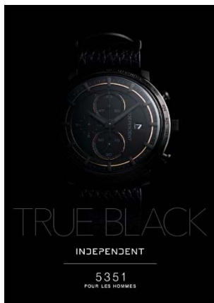
INDEPENDENT 5351 POUR LES HOMMES コラボレーションモデル 28,000円+税 数量限定600本

シチズン時計株式会社(本社:東京都西東京市 / 代表取締役社長:戸倉敏夫)は、自由な発想から生み出された独創的なテイスト・デザインを提案し続けるファッションウオッチブランド、『INDEPENDENT (以下、インディペンデント)』からファッションブランド「5351プール・オム」とのコラボレーション1モデル【28,000円+税】および「DRESSCAMP」とのコラボレーション5モデル【各30,000円+税】、そしてケース上部にりゅうずとプッシュボタンを配置した「INNOVATIVE line BULL HEAD」【20,000円~24,000円+税】を2017年10月5日(木)から順次発売します。 ※価格、発売日ともに予定です。