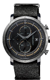
替えバンドイメージ